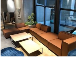
机 2脚 ソファ 4名分