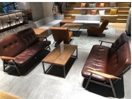
机 2脚 イス 6名分 ソファ 4名分 階段 8名分