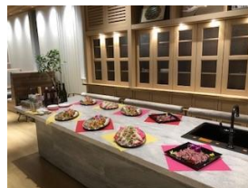
キッチンエリア_ケータリング一例