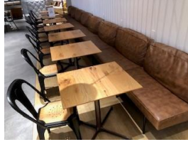
机 8脚 イス 8名分 ソファ 8名分