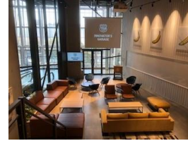
プロジェクタ/スクリーン 1式 移動式演台 1台

机、イス、ソファは移動可能ですので、主催者さまにてレイアウト変更をお願い致します イベント終了後は原状回復を宜しくお願い致します また、レイアウト変更時間、原状復帰時間もイベント時間に含まれますのでご注意ください 不明点ありましたら、ガレージスタッフにお声掛けください