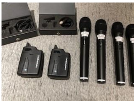
ハンドマイク ピンマイク 無線合計 4個 有線マイク 2個 マイクスタンド