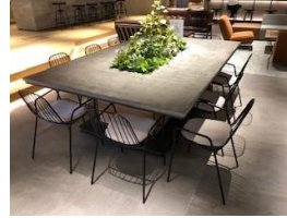
机 1脚 イス 10名分