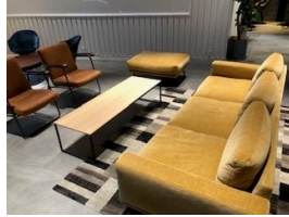
机 1脚 イス 2名分 ソファ 3名分