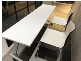
受付 イスが足りない時