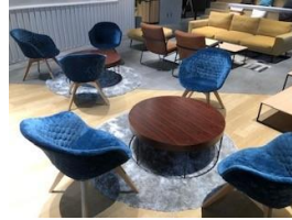
机 2脚 イス 6名分