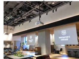
WEST/EASTエリアに各1式 合計 2式