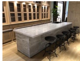
キッチンテーブル イス 5名分 スタンディングチェア