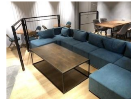
机 1脚 ソファ 5名分