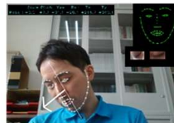
意識レベル低下に対する顔向き例