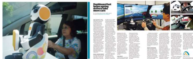
Nature 2022.3.17 掲載