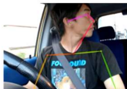
ドライバの姿勢推定