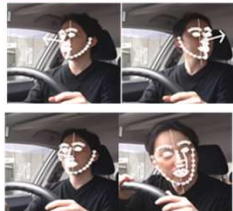
ドライバの顔向き推定