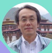
名城大学都市情報学部 教授

インドネシア・中国・ベルギー・スウェーデンの駐在を通じ、世界のモビリティビジネスとロジスティックビジネスのイノベーションビジネスモデルを推進。