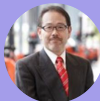
名古屋大学 客員教授

2015年東京大学大学院工学系研究科建築学専攻博士課程修了。博士（工学）。まちづくりや教育の現場における「わたし」の当事者性にも関心を持つ。