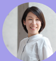
名城大学都市情報学部 准教授